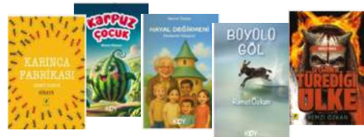
Remzi ÖZKAN Kitaplarından bazıları

01.07.1969 tarihinde Tokat'ın Erbaa ilçesine bağlı İverönü köyünde doğmuştur. Şair, yazar ve şarkı sözü yazarıdır. Günümüz şarkılarından birçoğunun altında söz yazarı olarak imzası bulunmaktadır.