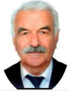
ALİ KÖŞKER Kültür ve Turizm Bakanlığı Halk Şairi

Şu kısacık ömrümüzde mutluluk içinde yaşayabilmek için, kalplerin sevgi ile dolması gerekir. Bu konuyu anlatan şiirimi paylaşmak istedim. Saygılarımla.