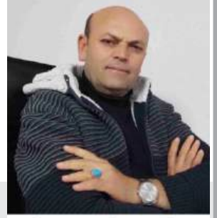
UZAK DUR GARDAŞ UZAK DUR