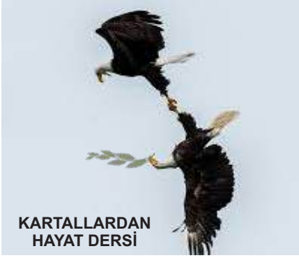
KARTALLARDAN HAYAT DERSİ

Bir dişi kartal, yavrularının babasını nasıl seçer?