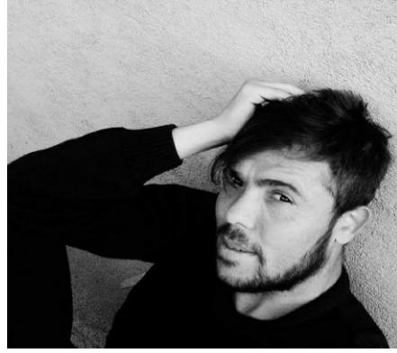
Mehmet Canbolat Aydınlar Mahallesi