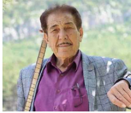
Aşık Hacı KARAKILÇIK

Aşık Hacı Karakılçık, 1948 yılında Adana'nın Feke ilçesine bağlı Tokmanaklı köyünde dünyaya gelen bir Türk halk ozanıdır. Küçük yaştan itibaren saz çalmayı öğrenerek aşık geleneğine adım atmış, düğünlerde, şenliklerde türküleriyle adından söz ettirmiştir. İlkokul mezunu olan Karakılçık, bir dönem Çukurova Radyosu'nda programlar yapmış ve Çukurova bölgesinde tanınan bir saz ustası olarak halk müziğine önemli katkılarda bulunmuştur.