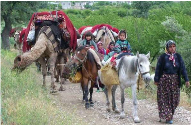
Bir Yörük Göçü

Yörükler özellikle Toros Dağları, Ege Bölgesi dağlık alanları, Batı Akdeniz ve İç Anadolu'da yoğun olarak yaşamaktadır. En bilinen Yörük grupları arasında Sarıkeçililer, Teke Yörükleri, Afşarlar, Türkmen Yörükleri yer alır. Bu gruplar genellikle yazın yaylalara, kışın ise ova ve kıyı bölgelerine göç ederler. Bu göçler sadece iklimsel değil, aynı zamanda kültürel bir ritüel olarak da algılanır. Her göç, bir geçiş dönemi ve yeniden doğuş anlamı taşır.