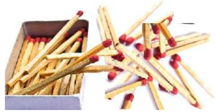
Son sayfadaki bulmacanın çözümü